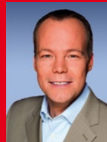
Dr. Matthias Miersch